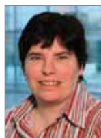
Nicole Bübl Ausstellerservice (kostenpflichtige Ausstellerausweise und Ausstellerparkkarten) Exhibitor services Technical accounting

[T] +43 (0)1 727 20-2711 [F] +43 (0)1 727 20-2749 karl.don@messe.at